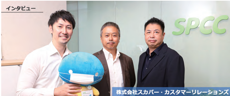
株式会社スカパー・カスタマーリレーションズ