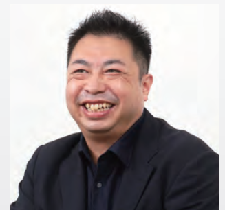
株式会社スカパー・カスタマーリレーションズ DX推進部 テクノロジー推進チーム