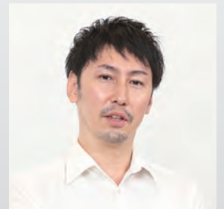
株式会社スカパー・カスタマーリレーションズ DX推進部 テクノロジー推進チーム